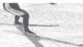
Langlaufspezialist: Verkauf - Miete - Kurse