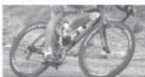
Radsportspezialist: Rennrad - MTB - Triathlon