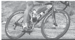
Radsportspezialist: Rennrad - MTB - Triathlon