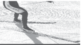
Langlaufspezialist: Verkauf - Miete - Kurse